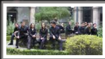
Orquestra de Clarinetes do Minho